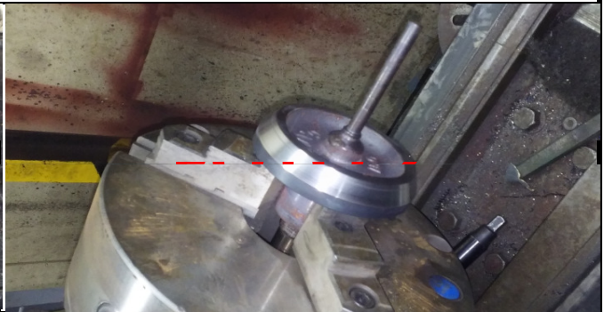
RECTIFICADO Y ESMERILADO