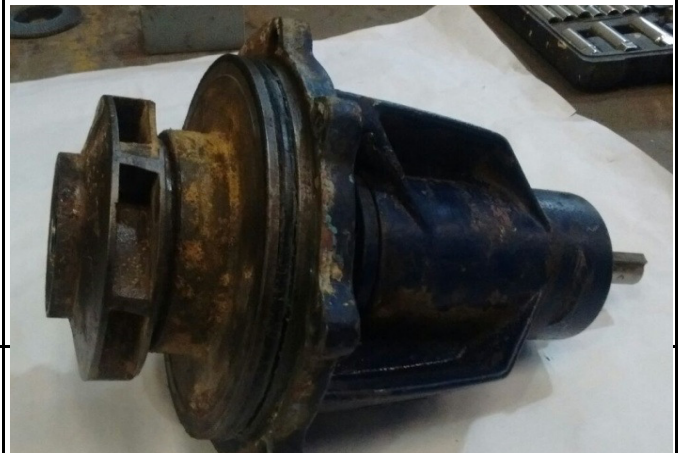
DESARME DE IMPULSOR