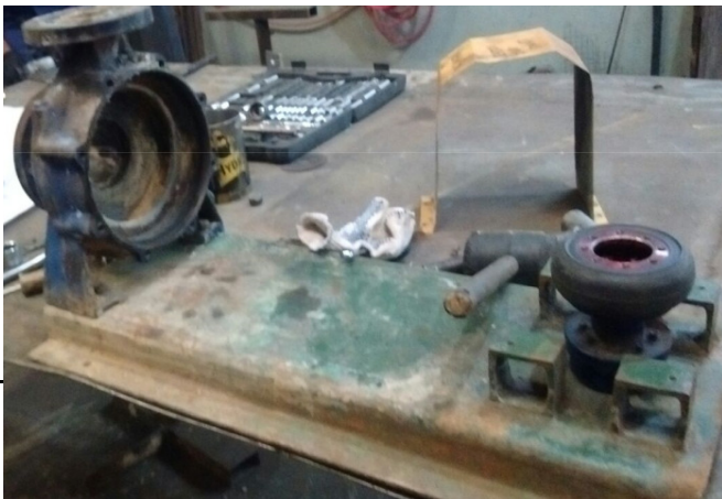
DESMONTAJE DE BOMBA

LA BOMBA SE ENCUENTRA BLOQUEADA EN SU ROTACION, SE PROCEDE A DESARMAR Y SE ENCUENTRA CON MUCHO MATERIAL RESIDUAL EN LA PARTE DEL IMPULSOR BOLSAS DE NAILON Y LAMINAS METALICAS, SE LIMPIA COMPLETAMENTE SE REVISAN RODAMIENTOS DE BAJA DE BOMBA Y DE MOTOR, LOS MISMOS SE ALLAN EN OPTIMAS CONDICIONES, SE REvisa MANCHON DE GOMA, SE CONTROLA EJE, TURBINA IMPULSORA, CARCASA, LAS CUALES SE ALLAN EN OPTIMAS CONDICIONES, SE PRUEVA ELECTRICAMENTE EL MOTOR SE MIDE AISLACION, BOBINAS, FUGAS DE CORRIENTE, CAJA DE CONECCIONADO YY PALETAS DE VENTILACION, TODO EN OPTIMAS CONDICIONES. SE PROCEDE A PINTAR LAS PARTES Y A ARMAR EL EQUIPO. MEDICION DE FASES R 2,56, S 2,58 Y T 2,56.