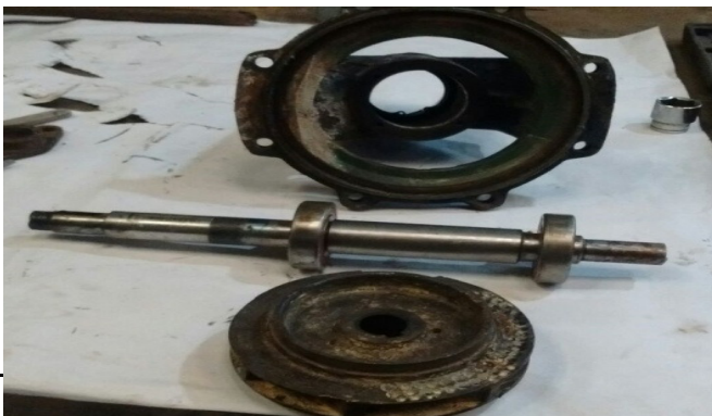
CONTROL DE ESTADO DE PARTES MOVILES