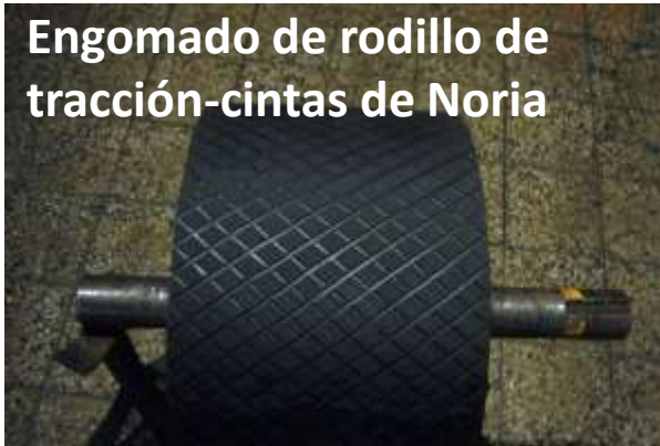
Engomado de rodillo de tracción-cintas de Noria