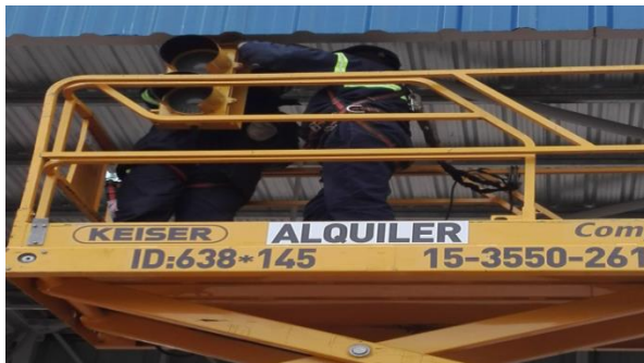
1 – Montaje de cañerías y cableado para la instalación eléctrica