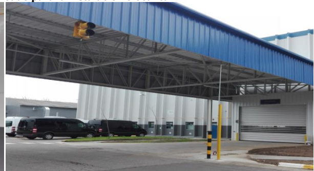
3 – Semáforos columnas soportes de barreras

Cód.de Informe: 001 – 01062018 – 003 Cliente: Industria Automotriz Lugar: Zona Oeste